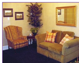
Le servimos tomando en cuenta sus costumbres y deseos.