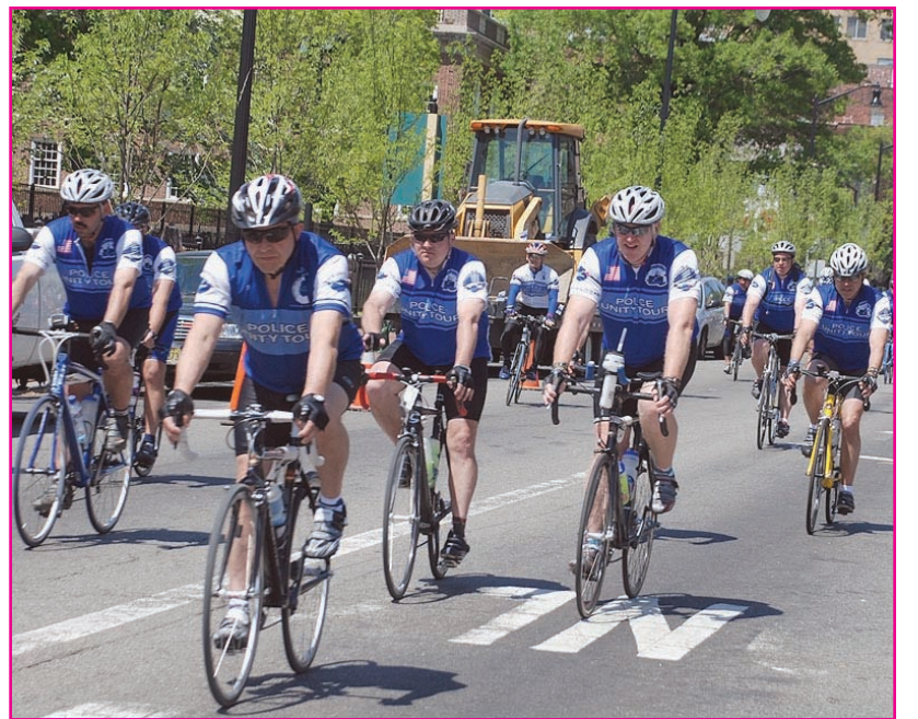
Momentos en que los ciclistas pasan por Broad, la calle principal de dicha ciudad.

Días pasados oficiales de la policía de diferentes ciudades en el área triestatal, a nivel nacional y otros países como el Reino Unido, India y Australia partieron rumbo a Washington D.C. para recaudar dinero para el Fondo y Museo Memoria de los Policías Caídos, en cumplimiento del deber. Los fondos recaudados serán destinados para ayudar a familiares de aquellos oficiales que han perdido la vida en el desempeño de proteger y servir a la población. La gira ciclista partió desde Nueva York para arribar al National Law Enforcement Officers Memorial (NLEOM) Washington, D.C. el 12 de mayo.