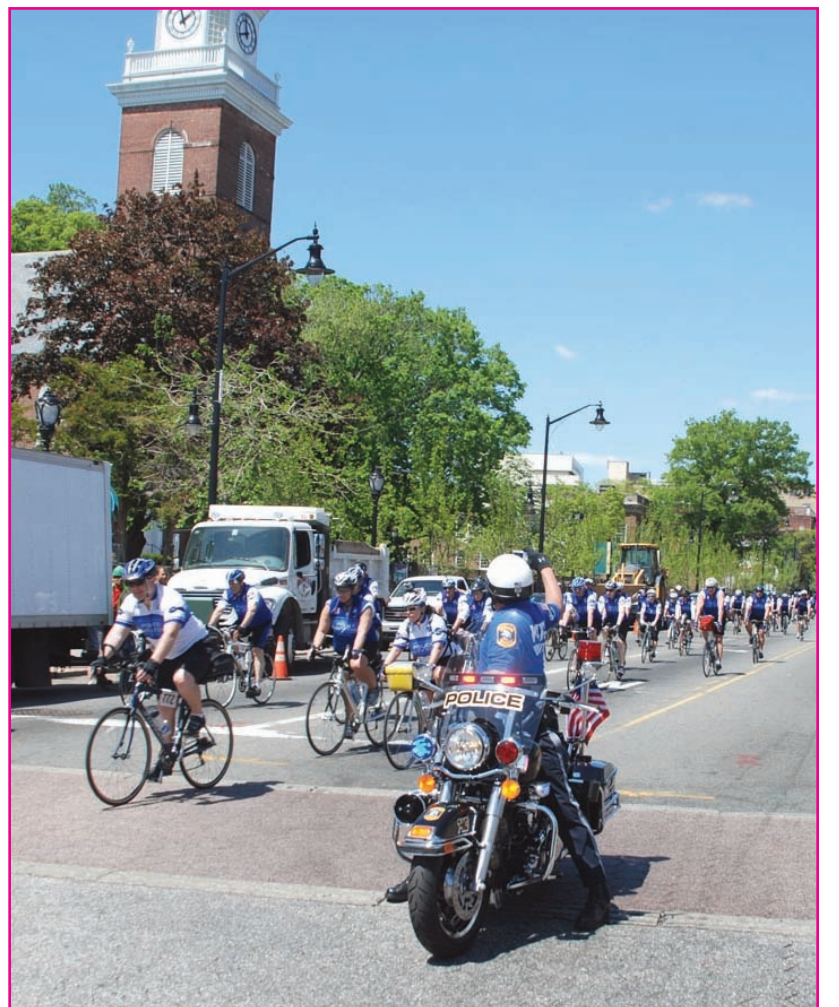
Los ciclistas escoltados por las motonetas policíacas. Al fondo se aprecia la histórica First Presbyterian Church de Elizabeth.